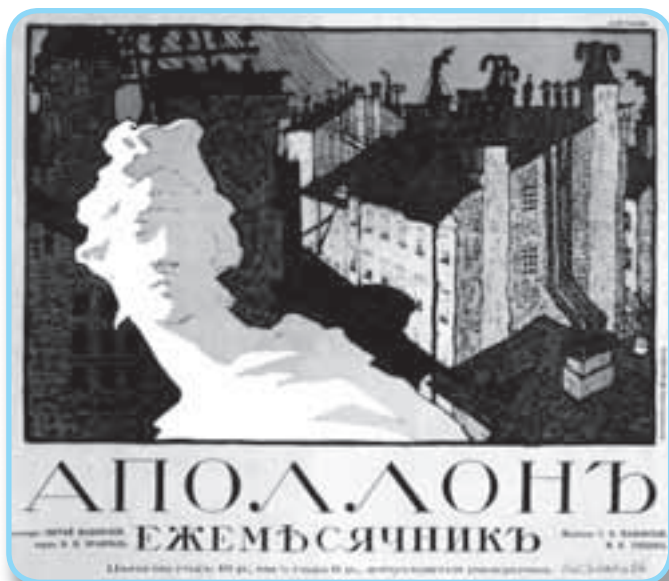
■ Рекламный плакат журнала «Аполлон»

2-й ведущий. Зинаида Николаевна полагала, что опустошенность, раздробленность и разобщенность людей — это главный грех ее поколения. У нее положительная программа такова: собственное «я» свободной личности, символ свободы и духовного спасения ЛЮБОВЬ, в особенности любовь неразделенная. Поэтесса обращается к Богу с просьбой укрепить волю и веру, придать силы, чтобы сделать долгую, но не рабскую дорогу. Ее «я» стремится стать соприродным божественному началу.