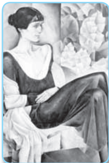
■ Анна Андреевна Ахматова. Художник Н. И. Альтман

2-й ведущий. 1910 год. Смутное время. Загадочное, тревожное. И вот появляются новые стихи, они подобны заклинаниям — это как бы ломка традиционной формы и содержания языка. Георгий Владими-