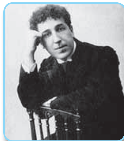
■ Игорь Северянин (Игорь Владимирович Лотарев)