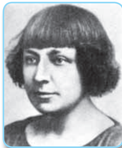
■ Марина Ивановна Цветаева