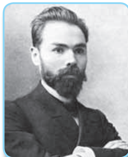
■ Валерий Яковлевич Брюсов