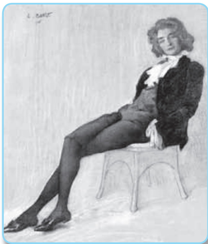
■ Зинаида Николаевна Гиппиус. Художник Л. Бакст Чтец

Как Бог, хотел бы знать я все о каждом. Чужое сердце видеть как свое, Водой бессмертья утолять их жажду — И возвращать иных в небытие.