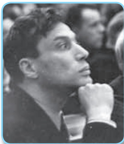
■ Борис Леонидович Пастернак