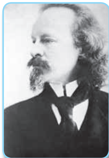
■ Константин Дмитриевич Бальмонт

2-й ведущий. Группа петербургских поэтов объявила новое течение — акмеизм (от древнегреческого «акме» — вершина, цветущая пора). В журнале «Аполлон» (1913 г.) появился манифест Николая Гумилева и Сергея Городецкого.