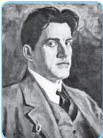
■ Владимир Владимирович Маяковский

Лохмотьями губ моих в пятнах чужих позолот. Дымом волос над пожарами глаз из олова Дай обовью я впалые груди болот. Ты! Нас — двое, Ораненных, загнанных ланями, Вздыбилось ржанье оседланных смертью коней, Дым из-за дома догонит нас длинными дланями, Мутью озлобив глаза догнивающих в ливнях огней. Сестра моя! В богадельных идущих веков, Может быть, мать мне сыщется; Бросил я ей окровавленный песнями рог. Конная скачет по полю Канавы зеленая сыщица Нас заневолить Веревками грязных дорог.