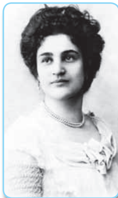
■ Мирра Александровна Лохвицкая

2-й ведущий. Дмитрий Сергеевич Мережковский и Зинаида Николаевна Гippiус — выдающиеся мастера художественного слова. Их творчеству суждено было стать объектом оживленных дискуссий, как в нашей