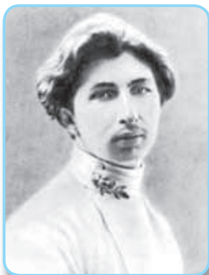
■ Сергей Митрофанович Городецкий