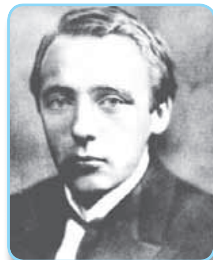
■ Велимир Хлебников (Виктор Владимирович Хлебников)