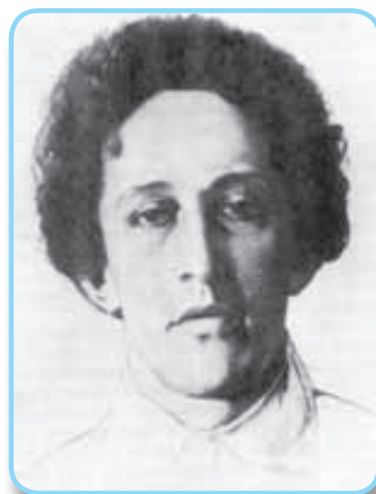
■ Александр Александрович Блок. Художник К. Сомов

Я счастлива жить образцово и просто: Как солнце — как маятник — как календарь. Быть светской пустынноницей стройного роста. Премудрой — как всякая Божия тварь.