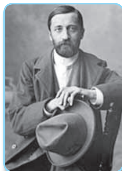
■ Дмитрий Сергеевич Мережковский