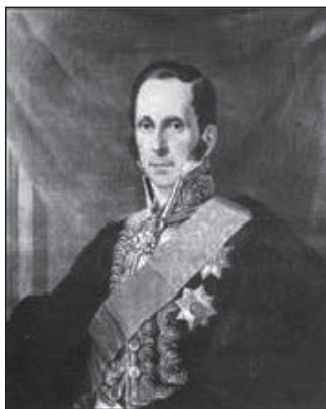
С. С. Уваров