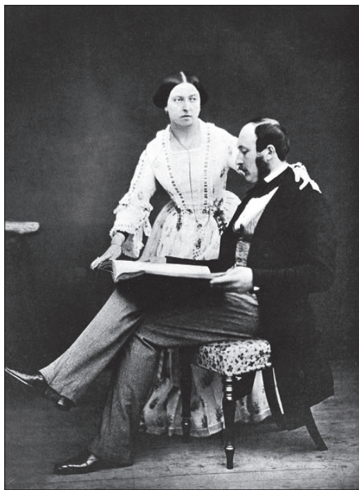
Королева Виктория и принц Альберт