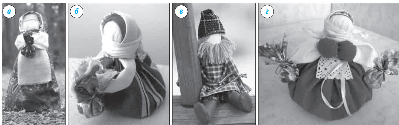
■ Куклы: а, б — подорожница; в —домовёнок; г — кубышка-травница

Сегодня рукотворная тряпичная кукла выполняет новую коммуникативную функцию: она стала живым средством общения и приобщения к народному культурному опыту, в котором нам многое созвучно. Она даёт прекрасную возможность познакомить ребёнка с культурным наследием своего народа.