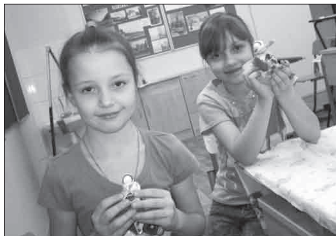
■ Учимся делать кукол