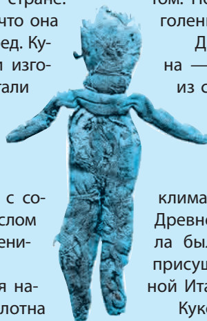
■ Тряпичная кукла, Древний Рим (IV–III вв. до н. э.). Высота 19 см (Британский музей)

В Египте найдена римская тряпичная набивная кукла: выполнена из грубого полотна и набита лоскутками и папирусом. Дети времён Римской империи играли не только куклами. Доподлинно известно, что в Древнем Риме были