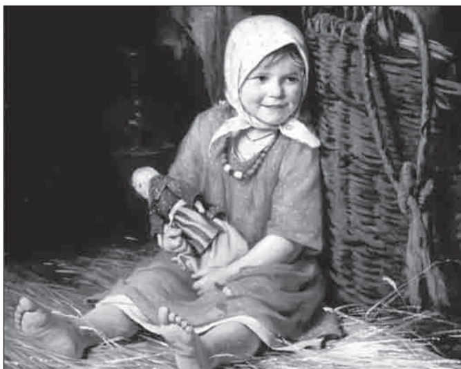
■ Первая кукла

В древности куклы служили обрядовым символом, они участвовали в магических заклинаниях и мистериях. Куклам приписывали различные волшебные свойства: они могли защитить человека от злых сил, принять на себя болезни и несчастья, помочь хорошему урожаю. Многие куклы-талисманы бережно хранили в семье, передавали из поколения в поколение вместе с традиционными приёмами их изготовления. Делали кукол, в основном, женщины — хранительницы родовых традиций.