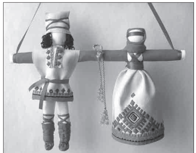
■ Свадебная обрядовая кукла Неразлучники