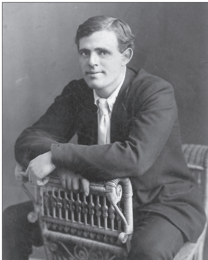
■ Джек Лондон