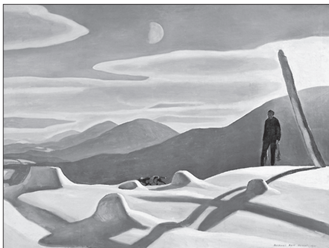
■ Роквел Кент. Охотник